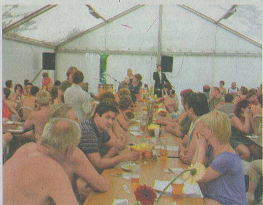
Színvonalas műsor Eperjesi Erikával és Jenei Károlyval